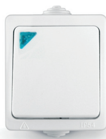
Выключатель одноклавишный с подсветкой