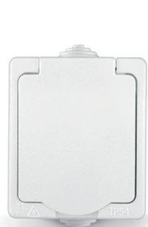
Розетка одноместная с/з, з/ш, с крышкой