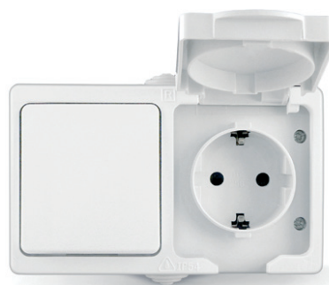
Блок. Выключатель одноклавишный + розетка одноместная с/з, з/ш, с крышкой